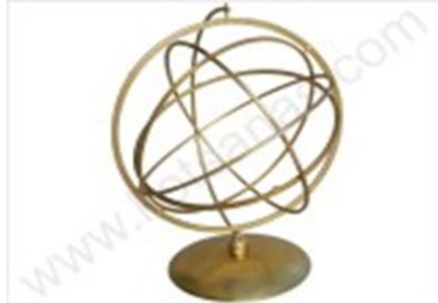
Ο αστρολάβος του Πτολεμαίου