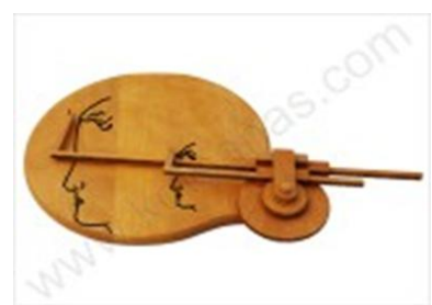
Ο παντογράφος του Ήρωνος

Σε μία προσπάθεια ανάδειξης αυτής της άγνωστης πτυχής του αρχαιοελληνικού πολιτισμού, το Ενυδρείο Κρήτης φιλοξενεί 25 πιστά αντίγραφα των συναρπαστικών αυτών εφευρέσεων.